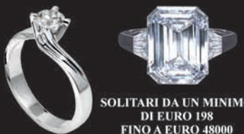
SOLITARI DA UN MINIMO DI EURO 198 FINO A EURO 48000