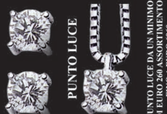
PUNTO LUCE DA UN MINIMO DI EURO 260 ASSORTIMENTO FINO A EURO 6960