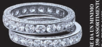
RIVIERE DA UN MINIMO DI EURO 350 ASSORTIMENTO FINO A EURO 16680