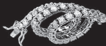
TENNIS DA UN MINIMO DI EURO 1270 ASSORTIMENTO FINO A EURO 19450