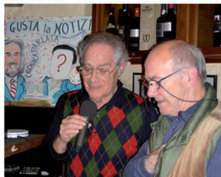
Mazzini - Maggi